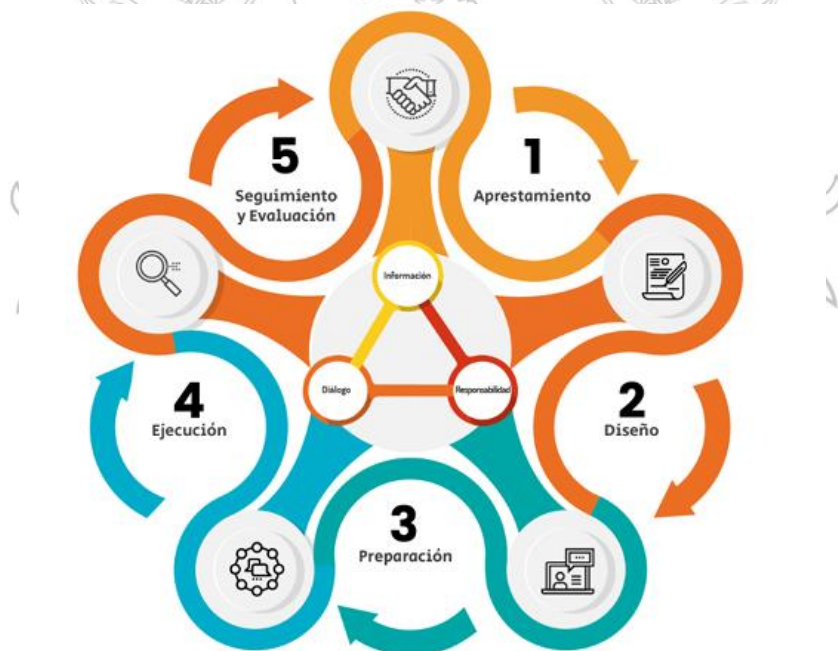
Figura 1. Fases de la Estrategia de Rendición de Cuentas El proceso de rendición de cuentas se desarrolla en cinco fases articuladas: aprestamiento, diseño, preparación, ejecución y seguimiento y

La aplicación de este esquema metodológico permite a la Gobernación del Putumayo fortalecer el diálogo entre Estado y ciudadanía, legitimar la acción institucional, garantizar la trazabilidad de los compromisos adquiridos y consolidar una cultura de rendición de cuentas como práctica permanente del buen gobierno.