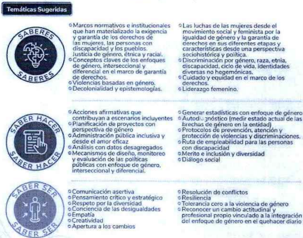
Figura 4. Temática sugerida PIC Eje 3.