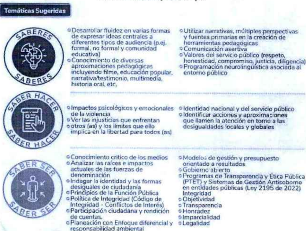
Figura 6. Temática sugerida PIC Eje 5

Ahora bien, "La identidad es fundamentalmente una cualidad subjetiva o de carácter individual, arraigada en el entendimiento del actor sobre sí mismo y, en gran medida, sobre la sociedad en la que vive. Lo que implica que, si cada uno de las y los servidores públicos y colaboradores del Estado reflejan en su actuar cotidiano esta característica, que de hecho hace parte de su perfil profesional y de su actitud hacia el trabajo, incidirá positivamente en que la dependencia y la entidad preste un mejor servicio al ciudadano y, si esto sucede, se reflejará en la confianza del ciudadano en el Estado.