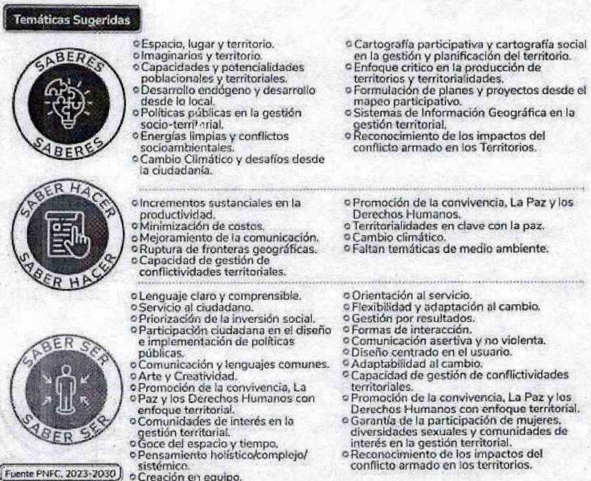
Figura 3. Temática sugerida PIC Eje 2.